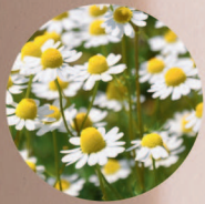
有機JAS認定 カミツレ花エキス