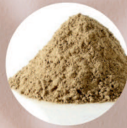
特許取得北海道産 ブルーベリー抽出水