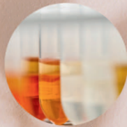
植物性プラセンタ様エキス