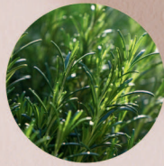
有機無農薬栽培 ローズマリー葉エキス