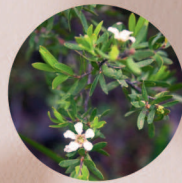
レモンセントティーツリー油

オーガニック原料のなかでも最高峰の「日本有機JAS原料基準」を取得した原料にこだわり、自浄作用を守りつつ清潔に潤いを保ちます。