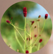
ワレモコウエキス