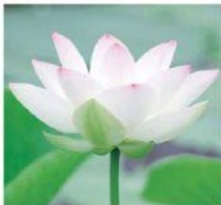
アボルフィン型アルカロイド 「ヌシフェリン」

ハス花の主アルカロイド成分の美白効果はアルブチンの10倍以上であることが判りました。